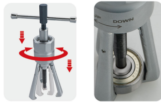
• Adjust the jaws by turning the screw