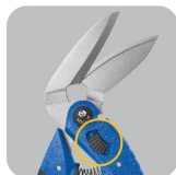
•Small angle of blades