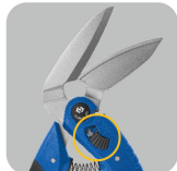
•Large angle of blades