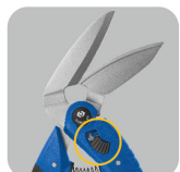
•Large angle of blades