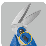
•Small angle of blades