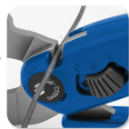
•Iron wire cutter