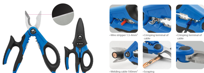
•Wire stripper 1.5-4mm 2