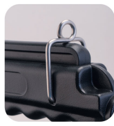
• Handle trigger with lock