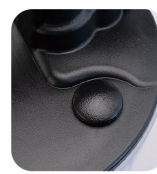
• Safety valve