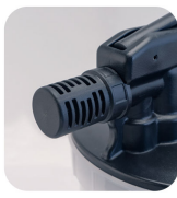
• New Silencer