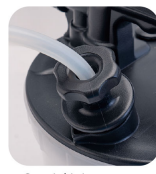
• Special joints are easy to connect