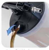
• Pour fluid hole