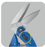
•Small angle of blades