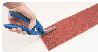
•Big angle design between blades and the handles of the scissors