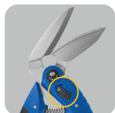
•Large angle of blades