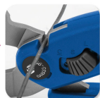
•Iron wire cutter