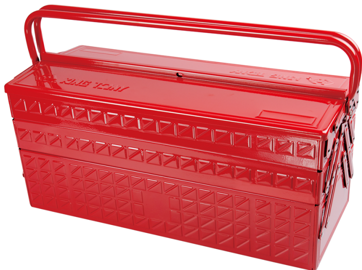
Metal tool box (STRENGTH Series - XL)