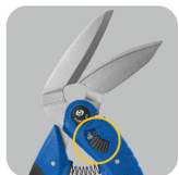
• Large angle of blades