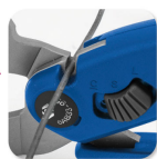
• Iron wire cutter