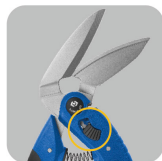
• Large angle of blades